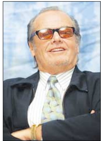
Jack Nicholson will gewohnte Eigenheiten ablegen.